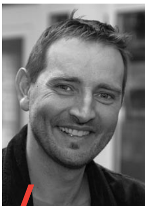
Jürg Guggisberg Bureau BASS

Les offices AI sont en mesure d'améliorer l'efficacité des mesures d'ordre professionnel. C'est ce que montre l'évaluation du placement dans l'AI que l'OFAS a confiée au Bureau d'études de politique du travail et de politique sociale (Bureau BASS). A cet effet, il s'agit de réformer ou d'adapter les structures et les méthodes de travail des offices AI. Une conception généreuse de la mise en place des mesures d'ordre professionnel, des groupes de travail interdisciplinaires appliquant des procédures de décision rapides, une gestion des collaborateurs par objectifs, ainsi que la constitution et le développement d'un réseau d'employeurs, telles sont les mesures qui pourraient concourir à l'obtention des résultats souhaités. On peut néanmoins se demander s'il suffit d'augmenter les ressources et d'enrichir la boîte à outils des offices pour permettre à la majorité des clients d'atteindre l'objectif de réadaptation.