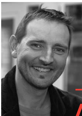
Jürg Guggisberg Bureau BASS

Le pourcentage des personnes percevant une rente AI est trois fois plus élevé chez les ressortissants turcs et deux fois plus élevé chez les immigrés originaires de l'ex-Yougoslavie que chez les Suisses. Alors que l'état général ressenti, bien plus mauvais chez ces deux groupes de populations que chez les Suisses, permet d'expliquer une grande partie des différences existantes, le statut social inférieur ne fournit qu'une très faible part d'explication. C'est ce que montre une étude confiée par l'Office fédéral des assurances sociales (OFAS) au bureau d'études de politique du travail et de politique sociale (BASS) sur les bénéficiaires de rente AI issus des immigrations turque et ex-yougoslave.