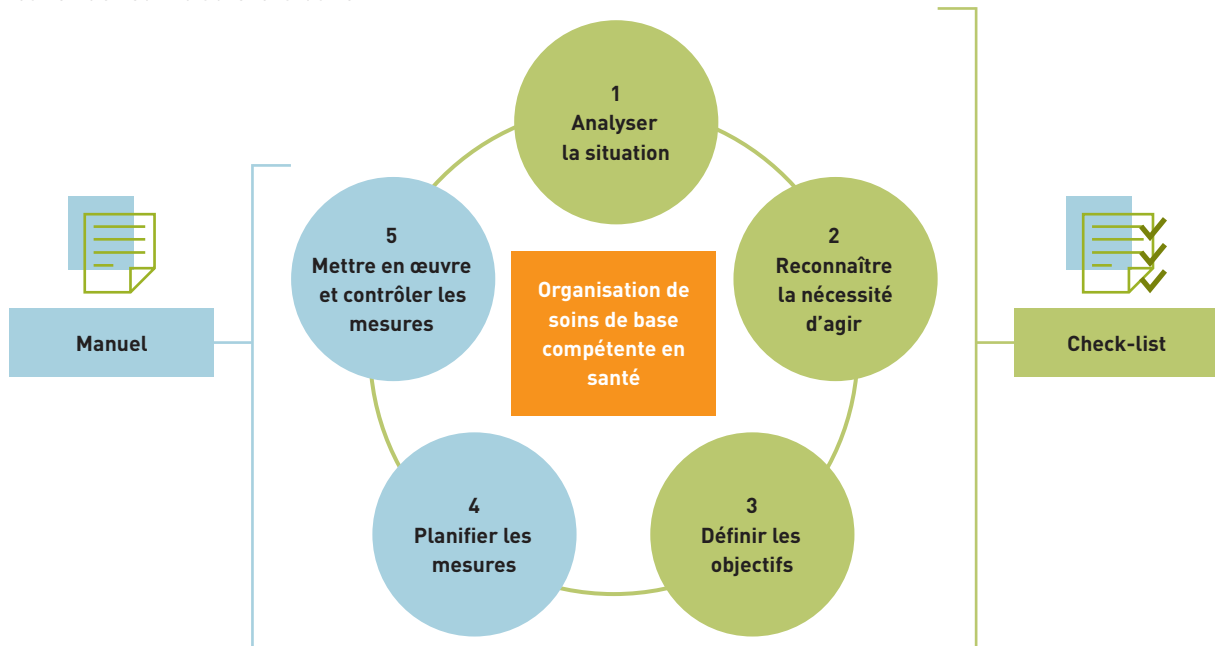
Utilisation de l’outil d’auto-évaluation